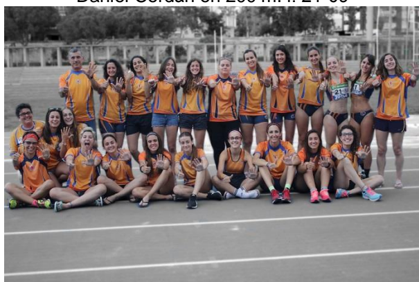
Equipo Absoluto Femenino, 6 temporadas seguidas en 1ª División Nacional.